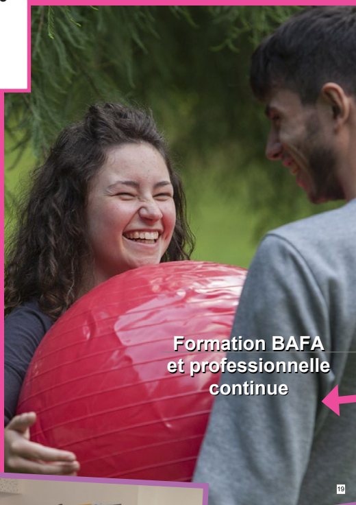
Formation Bafa et professionnelle continue

Certification Qualiopi obtenue fin 2021 102 stagiaires Bafa en 2022 3 formations professionnelles continues en 2022 Un très bon niveau de satisfaction générale