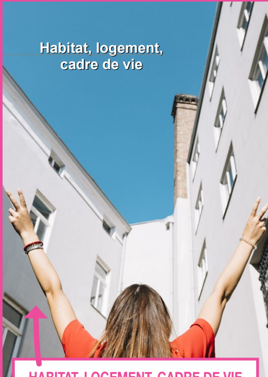
Habitat, logement, cadre de vie