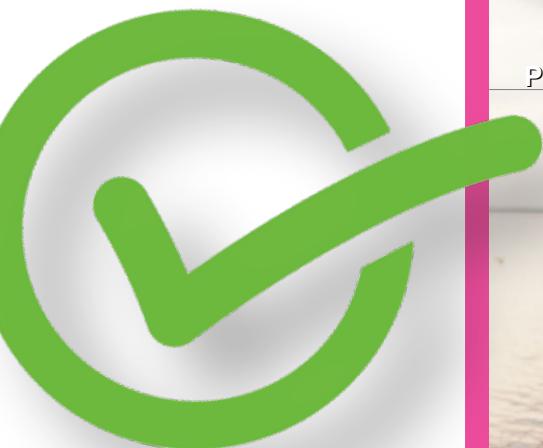
Petite enfance Parentalité